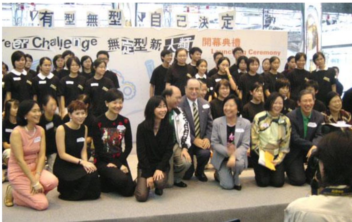
主禮嘉賓及一班「無定型新人類」攜手支持這個計劃。

數百名市民出席了由平等機會委員會主辦的「無定型新人類」在九月二十二日於太古城中心舉行的開幕典禮。一同分享當日的盛況吧！