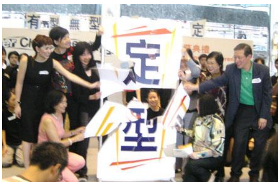
主禮嘉賓一同「打破」定型框框！